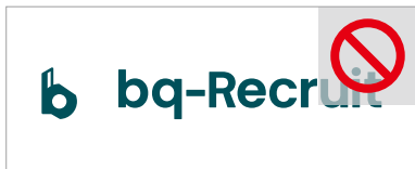
要素の一部が欠ける