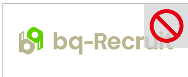
指定色以外での使用