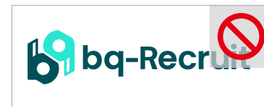
構成要素のバランスを変える