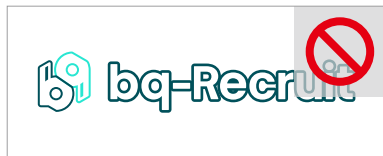
アウトライン表示にする