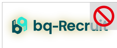
特殊効果を加える